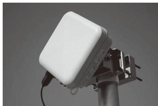
写真1 iPASOLINK SX外観

従来の60GHz帯では、広い周波数帯域を利用して低い変調方式で伝送する方式が一般的で、アンライセンスバンドであるため他の機器から干渉波を受けやすいという課題がありました。また、Small Cell Backhaulなどで多数の置局を行うと、他局からの干渉波の影響を受けることも想定されます。iPASOLINK SXでは、これらの干渉波を避けるために50MHzの狭帯域を採用しました。これにより60GHz帯で40チャンネルの中から選択して使用することを可