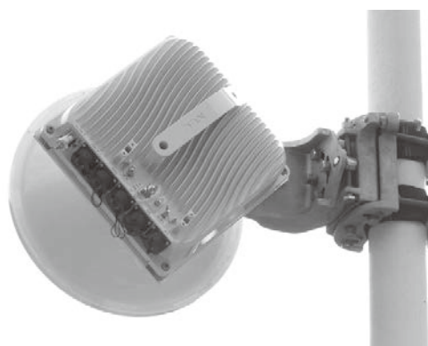
写真2 iPASOLINK EX外観

次にiPASOLINK EXのベースバンド部と無線送受信部の特徴について説明します。