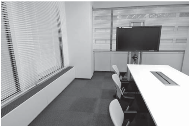
写真3 自然換気システム、自動制御電動ブラインド、Low-eガラスを採用

会議室やミーティングコーナーには、大型ディスプレイを標準装備しています。これによって、紙資料を使わない会