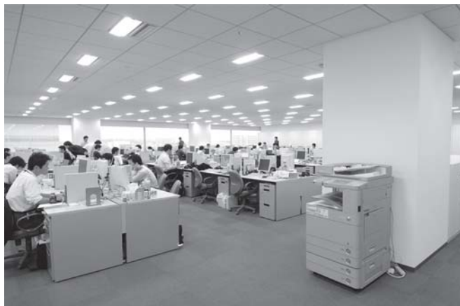
写真5 多人数で共有する複合機

Webカメラ、ヘッドセットを用意し、自席からも手軽に会議に参加できるWeb会議システムを採用しています。最大20名（画面表示は8名）まで参加でき、コミュニケーションの向上や、意思決定の迅速化を実現しています。