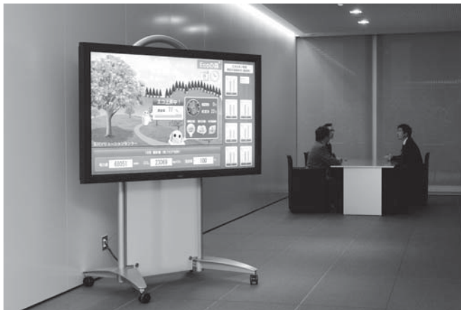
写真2 エネルギー使用量の見える化