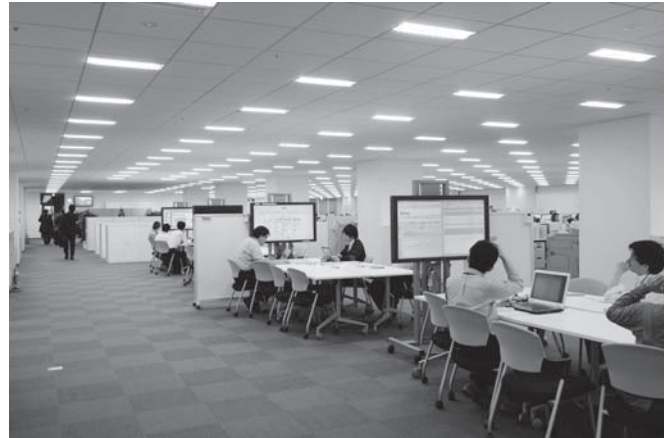
写真4 会議室やミーティングコーナーに設置されている大型ディスプレイ