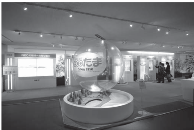
写真1 「ecoたま」見学コースの一部

川崎市内のNEC玉川事業場内に建設されたNEC 玉川ソリューションセンターは、地上12階・塔屋2階建て、建設面積