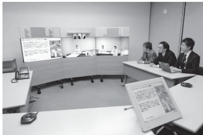
写真6 UC会議ソリューション

社内では内線電話、社外では携帯電話として利用できるデュアルフォンを採用しています。個人番号を割り当てる