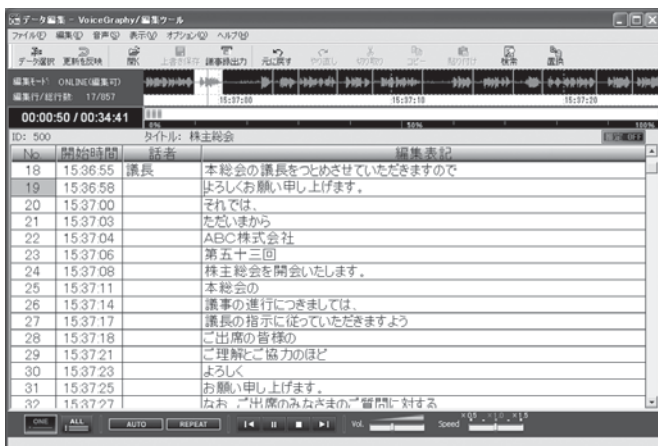
図2 音と文字が連動する編集ツールの画面イメージ