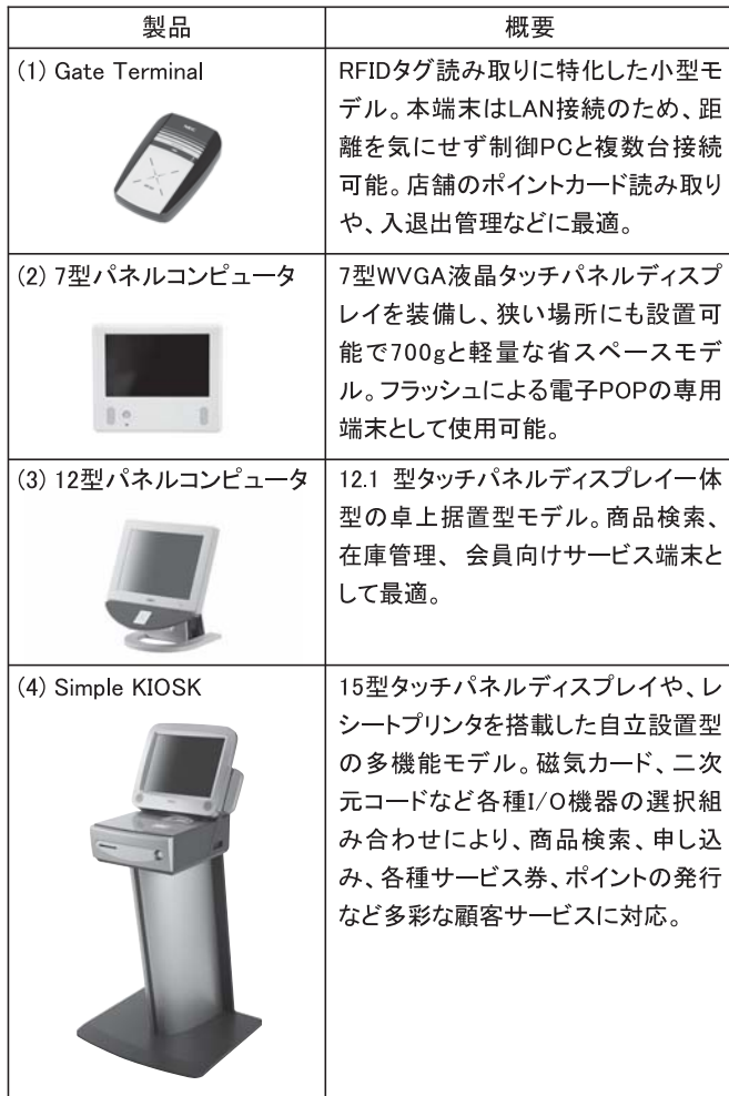
表2 マルチRW製品ラインナップ

ルコンピュータ（コンパクトモデル）、12型パネルコンピュータ（据置型モデル）、Simple KIOSK（設置型モデル）の製品化を予定しています（表2）。