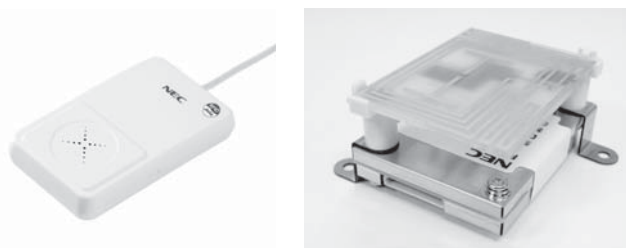
写真1 マルチRW (左: USB型読み取り装置、右:組み込みモジュール)

一方で、従来のバーコードも規格が数多く存在し、いまだに統一されていません。それでも不便を感じないのは、バーコードリーダがほぼすべての規格に対応しているからです。バーコードと同様に、RFIDでも1台のリーダライタ（以降RW）で主要なRFIDタグがすべて読み書きできれば、利用シーンは拡大し、さまざまなモノや人が交差する流通市場や個人利用にも広がるのが予想されます。