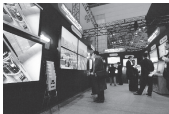
映像ディスプレイソリューションゾーン