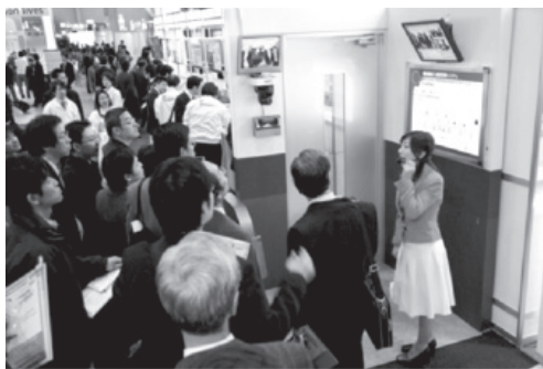
リスクマネジメントゾーン

各ゾーンでは説明パネルに見入ったり、説明員の解説に熱心に聞き入るお客様の姿が見られました。