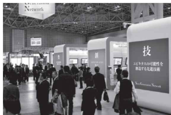
NGNで加速するユビキタス社会ゾーン