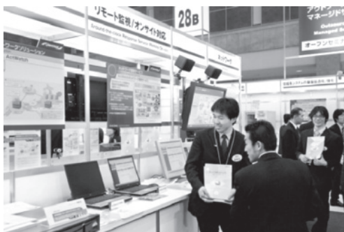
ライフサイクルマネジメントゾーン