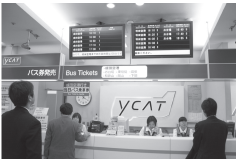
大型LCDディスプレイ導入事例 (横浜シティ・エア・ターミナル様)

NECグループでは2005年12月に開催した「iEXPO2005」でこの「Digital Signage」をご紹介し、ご好評をいただきました。「Digital Signage」の基本的なシステム構成事例は図のようになっています。このなかでNECディスプレイソリューションズは