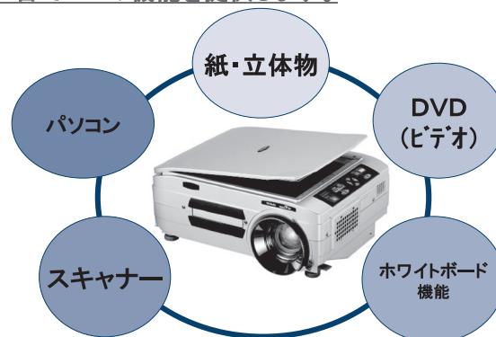
図1 iP Viewerの多彩な機能