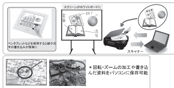
・iPシリーズプロジェクトとパソコンをUSBケーブルで接続しiP Viewerで、画面上に線や文字の書き込みや資料を電子データとして保存可能。