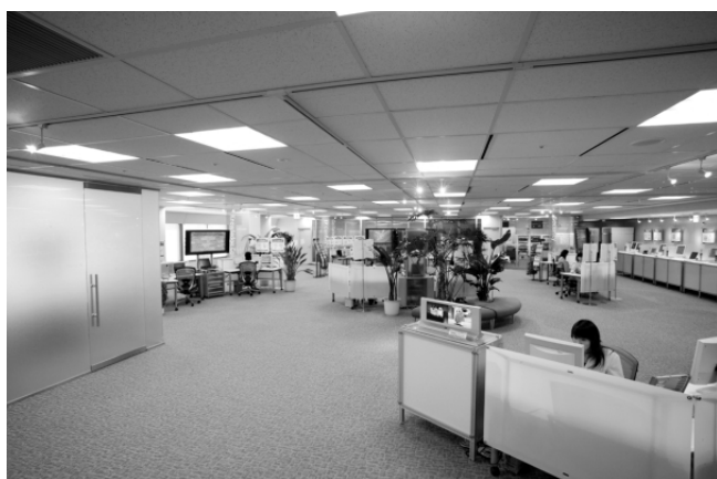
写真1 ショールームの様子 Photo 1 Appearance of showroom.

ショールームの様子は写真1に示す通りであり、また現在（7月リニューアル時点）の展示内容の詳細は図の通りです。