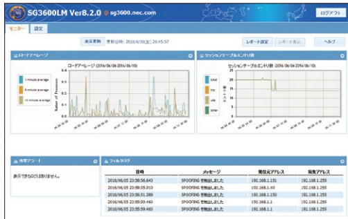
ダッシュボード画面イメージ

CPU使用率やセッションテーブルのエントリ数などの情報をダッシュボード画面に表示します。また表示されている情報を指定のタイミングでHTMLにして管理者に通知します。