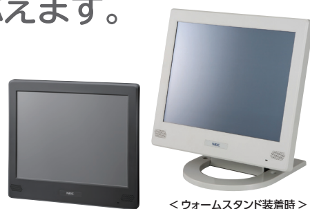
＜ウォームスタンド装着時＞

NECのパネルコンピュータは、直感的な操作が可能な15型のタッチパネル一体型コンピュータです。Windows® XP、Windows® 7モデルを用意。音量ボタン等の無効化設定など、誤操作やいたずら防止に配慮しています。充実の保守体制や壁掛けブラケットなどの設置オプション品により、どこでも安心してご利用できます。