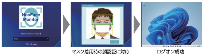
マスク着用時の顔認証に対応

パスワードを入力しなくても、カメラに顔を向ける動作でPCへログイン*1。マスクを着けたままでの認証にも対応しています*2。ログイン後も一定間隔で顔認証を行い、認証NG時に画面をロックします。社内でのなりすまし抑止はもとより、テレワークや外出時においても強固なPCセキュリティを確保できます。