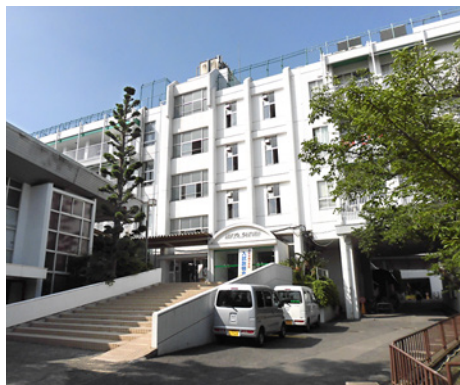
清教学園中・高等学校様 (大阪府河内長野市)

創 立 | 1951年(昭和26年) 所 在 地 | 大阪府河内長野市末広町623番地 業 種 | 学校教育 ホームページ | http://www.seikyo.ed.jp