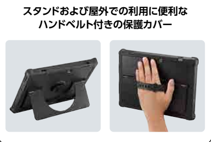
スタンドおよび屋外での利用に便利な ハンドベルト付きの保護カバー

⑤:Windows 10 Proの工場出荷状態へ戻すためのバックアップイメージの書き出しには「再セットアップメディア作成ツール」をご利用ください。本ツールによる書き出しは1回限りとなります。