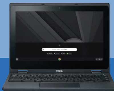
NEC Chromebook Y2