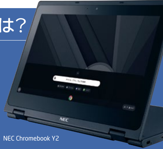
NEC Chromebook Y2