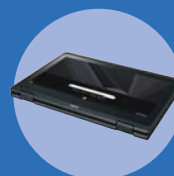
タブレットスタイル