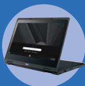
スタンドスタイル