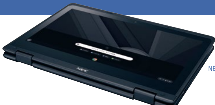
NEC Chromebook Y3