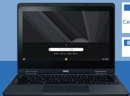
NEC Chromebook Y3