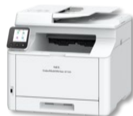
Color MultiWriter 4F150