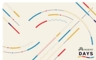
専用 IC カード