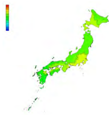
2011 年 ASHRAE Thermal Guideline の Class A1 を 適用し、寒冷期の換気取込み量を調整した場合 (温度 : 15~32°C、湿度 : 20~80%)