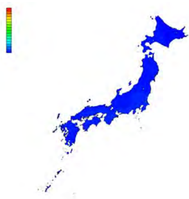
2004 年 ASHRAE Thermal Guideline を適用 (温度 : 20~25°C、湿度 : 40~55%)