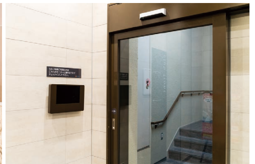
受付や入口に設置された顔認証システム

※本製品によりカメラ撮影した特定の個人を識別できる画像データは個人情報に該当します。プライバシーに配慮するとともに、個人情報保護法その他の法令および規則、ガイドラインなどに沿ってご利用ください。 ※本事例に登場する会社名、製品名は、各社の商標または登録商標です。