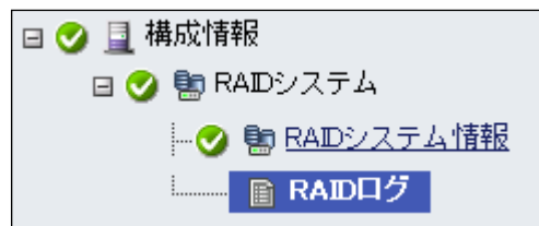
図3 HPE WBEM プロバイダの例