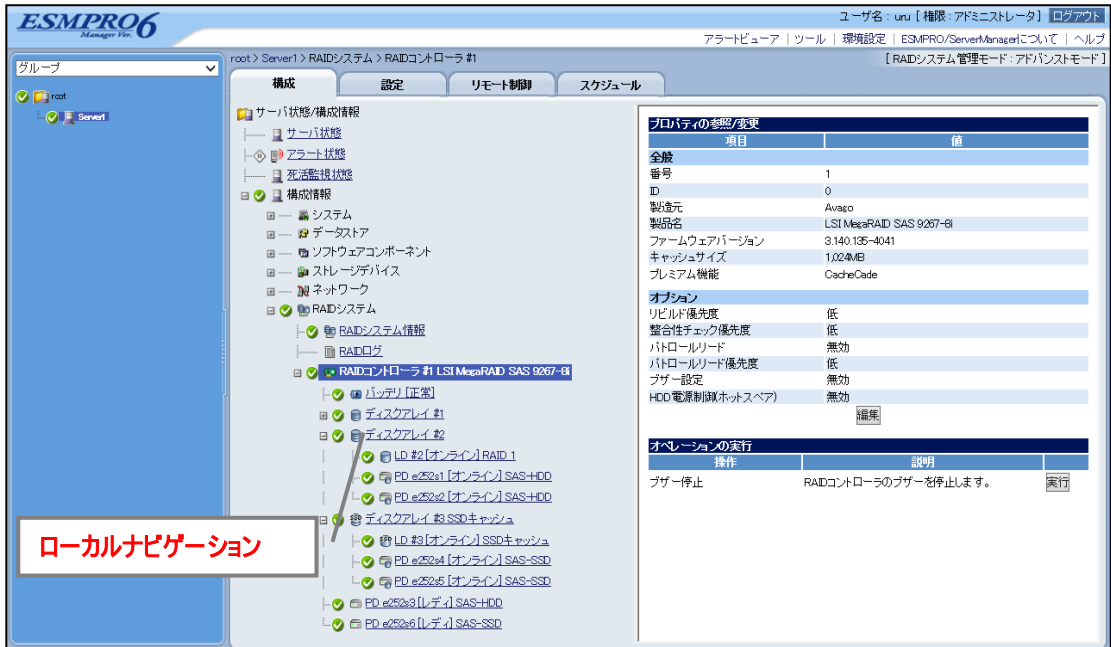
図1 ローカルナビゲーション