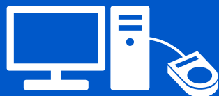
利用者ID登録システム

マイナンバーカードを社員証等のICカードとして流用。また生体認証を組み合わせることで、複数要素での本人認証による入退管理を軸としたフィジカルセキュリティをご提供します。