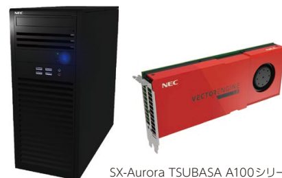
SX-Aurora TSUBASA A100シリーズ