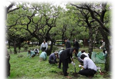
定期的にNECグループ社員が草取りなどを行っています