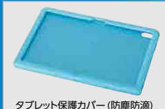
タブレット保護カバー（防塵防滴） [PC-VP-TS16]

学校の教育現場向けに、防塵防滴機能を備えたタブレット保護カバー（防塵防滴規格：IP42）をセレクトメニューでご用意。カバーを装着すると、埃や水滴などからタブレットPCを守るため、普通教室だけでなく校庭や校外学習でご利用いただけます。また、利用期間中は、カバーの交換によって外観を新しくできるため、次に使用する子どもたちも清潔感のあるタブレットPCを使うことができます。カバーは液晶画面まで丸ごと覆う形状となっており、特に傷や汚れが気になるタッチ画面も保護されます。