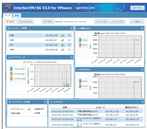
ダッシュボード画面イメージ

また、選択したリソース情報の内容を、指定のタイミングでHTMLにして管理者に通知します。