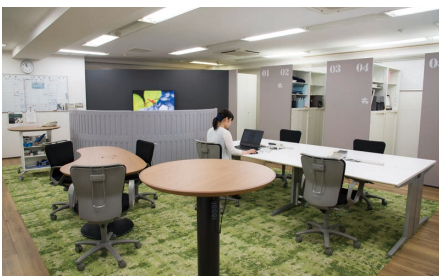
名古屋支店オフィス